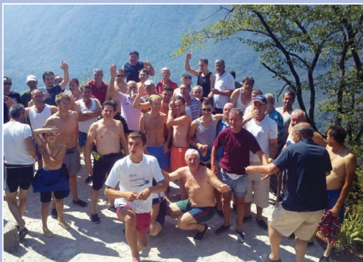
Na putu do Glavatičeva

sa fotografijama, a u izradi je i DVD sa video materijalom. Program je završen u 19.00 sati, nakon čega su učesnici autobusima prevezeni do željezničke stanice Konjic, odakle je vozom 390 bio organizovan povratak prema Sarajevu.