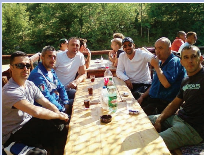
Druženje u bazi

izleta, u zadnjoj godini dana organizovane su i proslave 15. aprila - Dana željezničara u svim stanicama Direkcije Sarajevo, zajednički odlasci na fudbalsku utakmicu BiH - Grčka, tri puta u toku mjeseca Ramazana organizovani su kolektivni iftari u Hotelu "Bristol" u Sarajevu, ispraćaji kolega